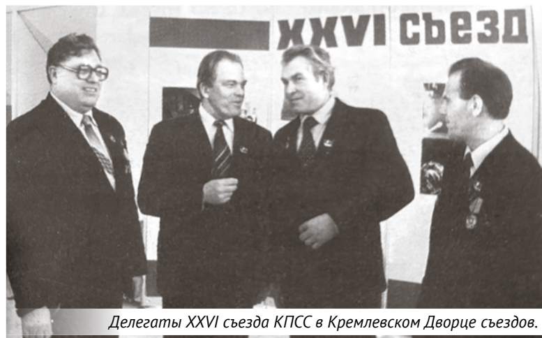
Делегаты XXVI съезда КПСС в Кремлевском Дворце съездов.