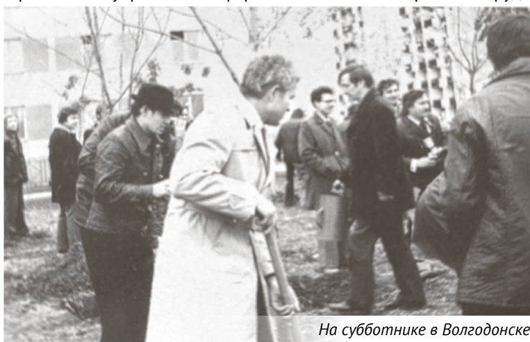
На субботнике в Волгодонске.