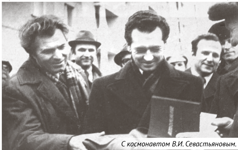
С космонавтом В.И. Севастьяновым.

Говорили о жизни, которая у него начиналась после срочной службы в армии. Меня интересовало, как, только появившись на стройке, он смог найти контакт с молодежью незнакомой, приехавшей на комсомольскую стройку из разных концов страны.